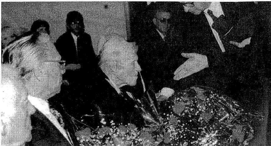
Profesor Syllaba při slavnostním udělování řádu